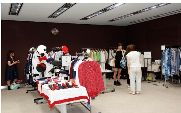
ガラス棟会議室での展示即売会