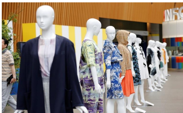
参加デザイナーの作品をマネキンにて展示