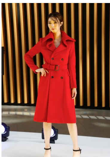
クールジャパンを発信