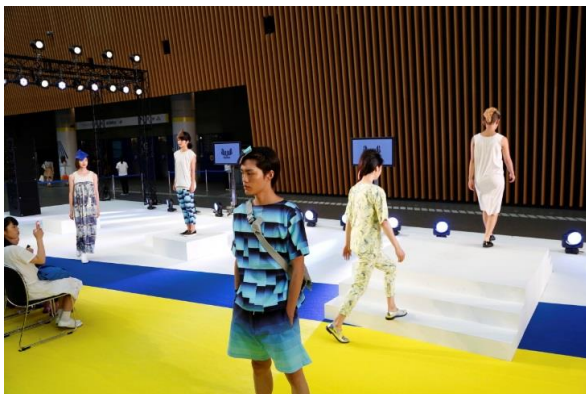
ロビーギャラリーでのインスタレーション

※3 インスタレーション:ランウェイ形式によらず、演出を施した空間でのファッションパフォーマンス