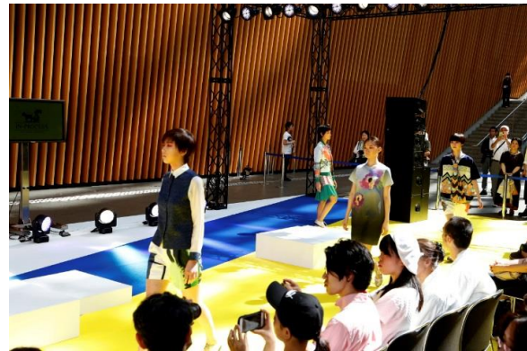
観客のすぐ近くにて展開