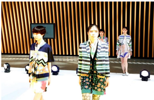
外光が差す明るい空間でのインスタレーション