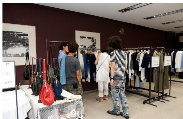
デザイナーとの交流が繰り広げられた