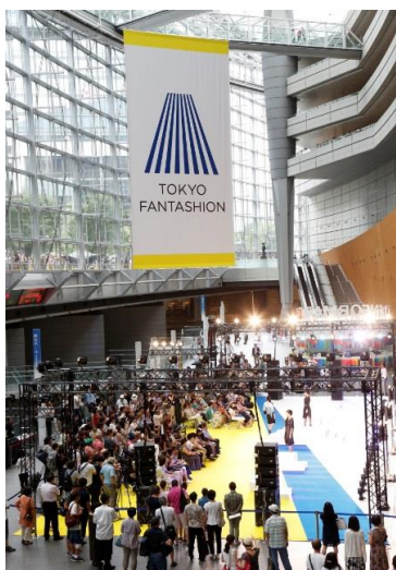
ガラス棟の巨大空間を効果的に利用