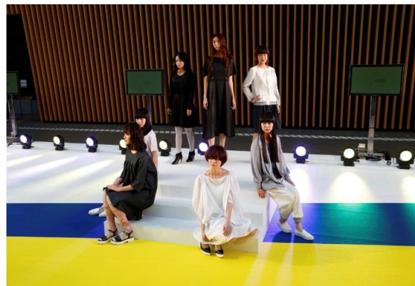
木の壁をバックにした展開