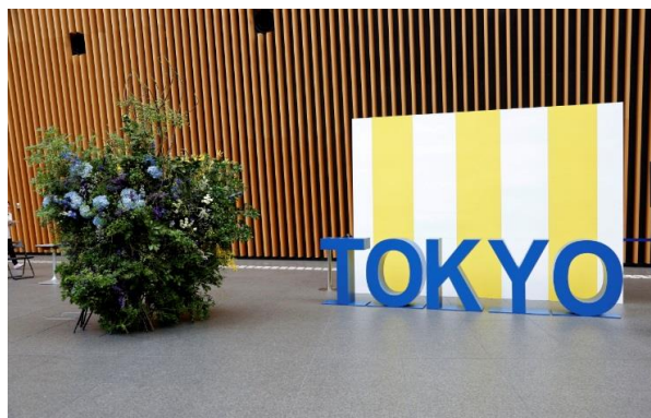
TOKYOの文字がデザインされたフォトブース