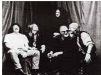
ディープ・パープル

お問い合わせ / 「トレピフォーラム2000」運営事務局 TEL.0120-234097