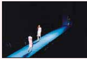
ピエール・カルダン総合展 (ホールB)