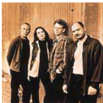
クロノス・クアルテット

4月19日(水) ホールC 19:00~ 料金 / S・5,800円、A・4,800円、B・3,800円