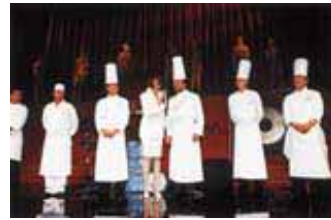
ステージを飾った流木のオブジェ 料理の鉄人が豪華に勢揃い