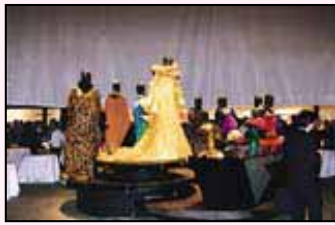
Primoparazzo NOVESPAZIO 2000春夏コレクション (ホールB)