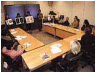
「第3回日本デジタルアート コンテスト」審査会場風景