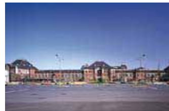
駅舎建て替え計画が検討されている東京駅

「大手町・丸の内・有楽町地区再開発計画推進協議会」 TEL.03-3287-6181 http://www.lares.dti.ne.jp/~tcc