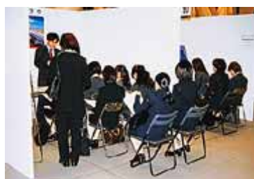
熱気あふれる会場の模様

「こちらのホールでの開催は3回目ですが、交通アクセスも良く、細かい配慮をしていただけるので大変気に入ってます」（参加企業の担当者）