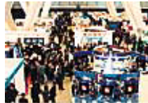
昨年の会場の様様

10月18日(水)~20日(金) 展示ホール、ロビーギャラリー、映像ホール 10:00~ 料金/1,000円 1989年、日本におけるデータベース・サービス産業の確立をめざして誕生した「データベースTOKYO」は、今や、わが国のデータベース産業全体のトレンドと最新情報を提供する国内最大のデータベース総合展へと成長しました。だれもがどこでも簡単に情報とアクセスすることができるようになった情報化時代に、データベース・サービスとデータベース構築システムがビジネスにもたらす絶大な効果を、展示会ならではの形でお見せする「データベースTOKYO」。第12回目を迎える今回も、ぜひお見逃しなく。