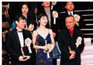
ホールAで開催された 第20回日本アカデミー賞授賞式にて

今後もまだまだいろいろな作品を踊っていきたいと思います。今まで20数年バレエをやっても踊っていない作品がたくさんあるんです。バレエの中でやりたいなと思うことをまだやり尽くしていないので、あまり新しいことには目がないんです。というか、それは私の性格的なことなのかもしれませんが・・・。段階を踏んで確実にいろいろなことを習得しなければ、逆に基本的なことが崩れてしまう。蓄積には時間がかかるし難しいけれど、崩れるのは簡単です。そのへんは自分の分をわきまえてないと、と時々思っています。