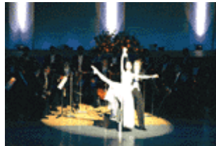
今年4月にホールAで開催された「トヨタ・ミレニアム・コンサート」

東京国際フォーラムもある分野に限定した専門的な劇場を目指すより、どんな分野においても、たとえば舞台芸術では、バレエもお芝居もミュージカルもコンサートも分野を限定することなく、質の高さを追求する事が一番大切だと思います。バレエやオペラなどの伝統的でアーティスト的なものばかりにかたよりすぎては、たくさんのお客さまには受け入れてもらえない。お客さまに来ていただくためには、いろいろなジャンルを同列に並べて質を追う、そしてお客さまに「好きなものを選んで観てください」というスタンスが、東京には合っている気がします。どんなイベントだろうと、中身が充実していて、初心者の方にも目の肥えたお客さまにも対応できる、それが理想ではないでしょうか。そうなればバレエもいろいろなお客さまにとって身近になるし、それがエンターテインメントということではないかと思うのです。