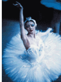
「白鳥の湖」のオデット

アーティスト的なものをやろうとして空回りするのはよくあることで、むしろゴチャゴチャの状態が日本らしいのではないかと、専門性をめざすよりも、いろいろなものが同列に存在する方が今の時代にふさわしいのではないかと思います