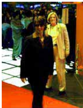
ホールAに登場した トム・クルーズ