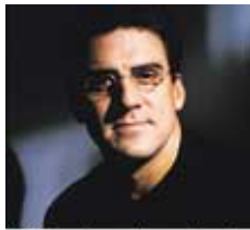
指揮：ディルク・ブロッセ

指揮：ヤーヤ・リン、歌手：フィリッパ・ジョルダーノ、ヴァイオリン：古澤巖、管弦楽：スーパーワールドオーケストラ