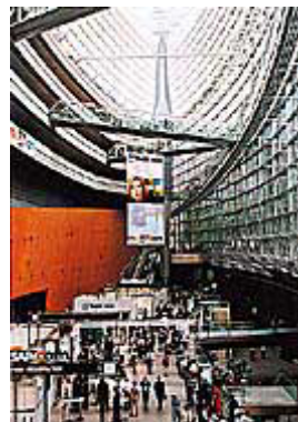
大勢の来場者で賑わう ガラスホール棟

7月18、19日、IT関連企業が一堂に会する「SAPPHIRE（サファイア）2000 TOKYO」（主催：SAPジャパン株式会社）が、東京国際フォーラム全館をフル活用して大々的に開催されました。イベントのテーマは「eビジネスを、リアルビジネスへ」。基調講演と特別講演で構成されたジェネラルセッションや、インターネット時代の市場ニーズに応えるために必要な情報を提供するブレイクアウトセッションなどが行われました。また、最新技術のデモンストレーションが行われたエキシビションも大好評。国内有数の大手企業から未来にはばたくベンチャー企業まで、これからのインターネット経済の発展に熱い注目を寄せていました。