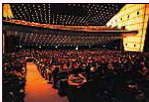
レニングラード国立バレエ開演前の ホールA観客席

レニングラード国立バレエの「くるみ割り人形」と草刈民代さんが客演なさっている「白鳥の湖」は、すっかり東京国際フォーラムの年末年始の恒例行事になたかの感があります。ホールAではそれ以外にも国際的に注目を集めている多彩なダンス公演が開催されてきました。モダンダンスのアルビン・エイリー舞踏団や、フラメンコのホアキン・コルテス、アイリッシュダンスの「リバーダンス」や「ロード・オブ・ザ・ダンス」、そして雅楽の「人長舞」などいずれも大きな話題を巻き起こしたことは記憶に新しいところです。