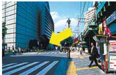
JR有楽町駅前にある駐車場入り口