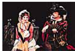
「ドン・ジョヴァンニ」

10月12日(木)・14日(土) ホールC 12日「ドン・ジョヴァンニ」18:30~、14日「ポッペアの戴冠」18:00~ 料金/S席15,000円、A・12,000円、B・9,000円、C・7,000円、D・5,000円、学生席5,000円 1991年の初来日以来、すでに3度の来日をはたし、その高度に音楽的かつ演劇的な独創性あふれるステージで日本のファンを魅了し続けるモスクワ・シアター・オペラ。今回上演するのは、ロシア最高の演出家ボクロフスキーが持てる才能の限りを注ぎ込んだ「ドン・ジョヴァンニ」と「ポッペアの戴冠」の2演目。演出の神様の手によるユーモアとヒューマニズムあふれる感動の舞台にご期待ください。