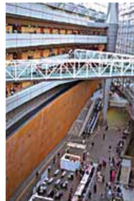
オーディオ賞でにぎわう ガラスホール棟

10月13日（金）から15日（日）の3日間、国内外の世界的に優れたコンポーネントが一堂に会する「2000東京インターナショナルオーディオショウ」が開催されました。国際的にも評価の高いこのオーディオショウは、東京国際フォーラムで開催されるようになってから今年で4年目。最新のオーディオ機器、一流メーカーの憧れの名機を実際に見、その素晴らしい音色を実際に試聴できるとあって、会場となったD棟3室・ガラスホール棟4・5・6階の24室の会議室は連日オーディオファンで大盛況。D棟とG棟を結ぶ空中ブリッジを大勢の人々が行き交っていました。