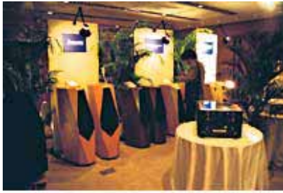
最新型オーディオ機器の展示

満足のいく環境ですね。これからも当イベントの定番会場として、未永く利用させていただきたいと思っています。」（事務局スタッフ）