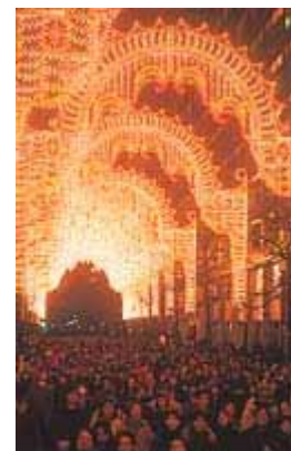
東京ミレナリオTM