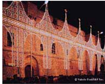
イタリアで展示された「スパッリエラ」

今年の『東京ミレナリオ』は、東京国際フォーラムのピアッツァが祝祭の完結性を演出してくれます。光の回廊を歩いた後、友人や家族で感動を語り合ったり、恋人たちが光の中で見つめ合ったりする心の触れ合いの場所になるでしょう。東京国際フォーラムには、幅30m、高さ17mの壮大な作品が配置され、都市を祝祭の場面に変容させます。祝祭は、人が集うことで成立します。多くの人が集まれば、その数だけ感動が誕生するのです。情報化が驚くほどの速さで進んでいく今日、私たちは、様々な情報を机の上で見ることができます。しかし、自分自身で動き、手と手をとって感動を肌で確かめ合うことの大切さをもう一度大切にしたいと考えます。21世紀のやさしい街づくり、やさしい人間関係は、心の触れ合うコミュニケーションの中から生まれるのです。祝祭というコミュニケーションのあり方を実験する壮大な舞台装置が、東京国際フォーラムであり、そこには、無限の可能性が感じられるのです。