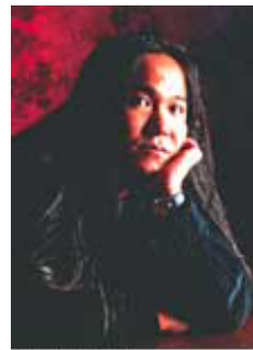
青山真治監督

お問い合わせ/ぴあ(株)PFF事務局 TEL.03-3265-1425 http://www.pia.co.jp/hot_cinema/pff