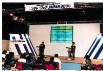
去年開催した【ベンチャーフェア JAPAN2000】の会場風景(展示ホール)