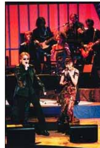
BSデジタル開局記念 「松任谷由実 ワンナイトコンサート」