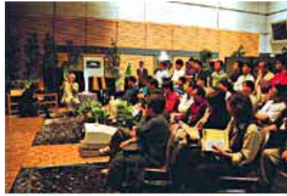
評論家を囲んでオーディオ講座も数多く開催された