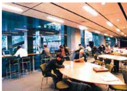
インターネットが楽しめるラウンジ

東京国際フォーラム1F・交流ロビーが、11月から明るくオープンなイメージにリニューアルしました。大小のテーブルが並ぶラウンジは、ご来館の皆様にご自由にお使いいただけるよう常時開放。プラザの檜木立を眺めることのできるハイカウンターには、インターネットを無料で楽しめるパソコンを5台設置しました。持ち込みでの飲食もできますから、ランチタイムをここで...という方もOK。各ホールで開催されるイベントの待ち合わせ場所としても最適です。多彩な情報とアクセスできるフレキシブルな憩いのスペースとして、新しくスタートした交流ロビー。ぜひお気軽にご利用ください。