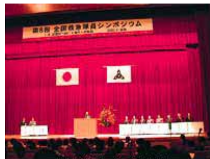
前回(第8回)の開催風景