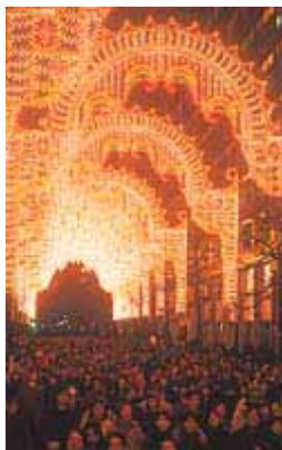
東京ミレナリオ TM