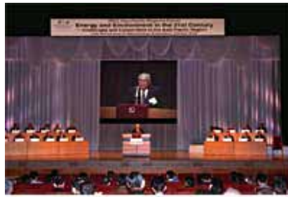
ホールCでの開会式

安全で安定したエネルギー供給の問題は、人類の未来に関わる重要なテーマのひとつ。そのカギとも言える「世界エネルギー会議 アジア太平洋地域フォーラム」が、10月18、19日、東京国際フォーラムのホールB及びホールCで開催されました。今回のテーマは「21世紀におけるエネルギーと環境 アジア太平洋地域の課題と協力」。エネルギー業界の第一人者や世界各国の代表的機関のリーダー、企業のトップをはじめ、20ヶ国から総勢約600名の参加があり、有益な議論が展開されました。今後エネルギー関連では、2003年に「世界ガス会議東京大会」が予定されており、東京国際フォーラムでは、ホールAで、開会式が開催されることになっています。