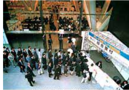
前回開催風景(展示ホール)