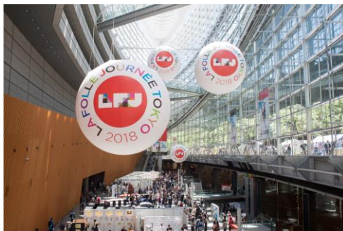
TIF ガラス棟内の会場装飾