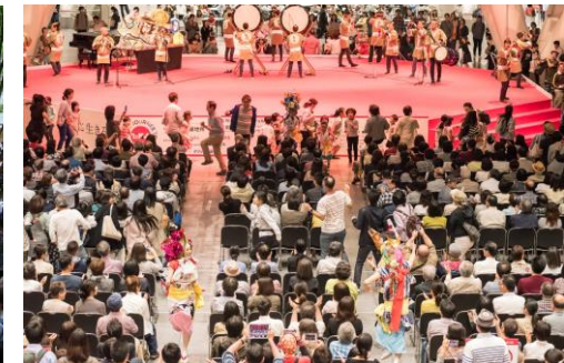
フォル・ニューイ(聴衆参加型イベント)