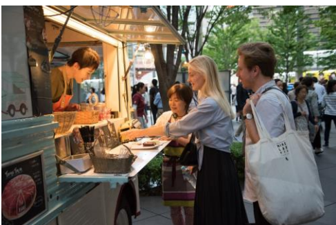
地上広場に多数展開するキッチンカー