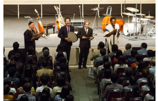
＜ホールA 0歳からのコンサート/ホールC・ホールB7等 多彩な有料公演の数々＞