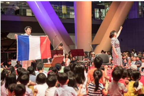
子どもたちの音楽アトリエ(ワークショップ)