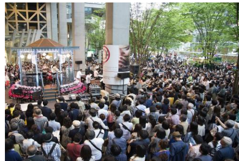
地上広場 キオスク(無料公演)ステージ