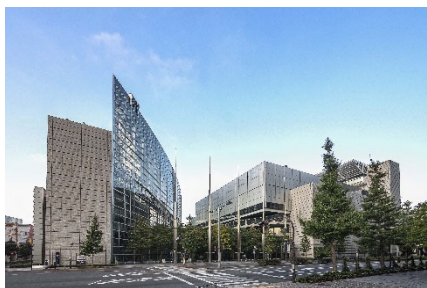
東京国際フォーラム 外観

弊社では今般の受賞を糧に、日本の経済・文化の中心地における「都心型MICE」の中核施設として一層の存在感を高めていくとともに、2023年3月に逝去されたヴィニオリ氏による優れた建築を未来に継承するために、東京都や周辺エリアと連携しながら更なる発展に努めてまいります。