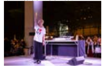
<地上広場 キオスク(無料公演)ステージ/フォル・ニュイ(聴衆参加型イベント)>