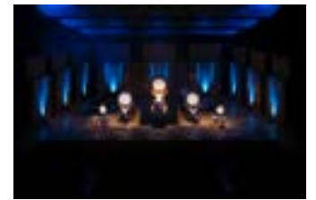
<ホール A 0歳からのコンサート／ホール C ・ ホール D7・G409 多彩な有料公演の数々>