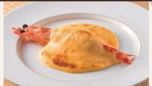
海老と舌平目のグラタン“エリザベス女王”風