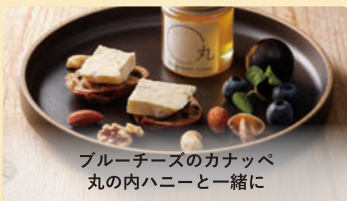
ブルーチーズのカナッペ 丸の内ハニーと一緒に