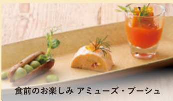
食前のお楽しみ アミューズ・ブーシュ

ジューシーな豚肩ロースと甘酸っぱいバルサミコのソースの組み合わせをお楽しみください。