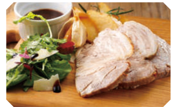
豚肩ロースのロースト 甘酸っぱいバルサミコのソース

ジューシーな豚肩ロースと甘酸っぱいバルサミコのソースの組み合わせをお楽しみください。