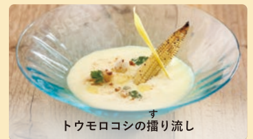
トウモロコシの す 振り流し