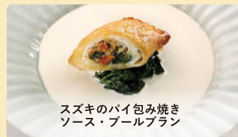
スズキのパイ包み焼き ソース・ブールブラン