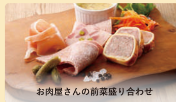
お肉屋さんの前菜盛り合わせ