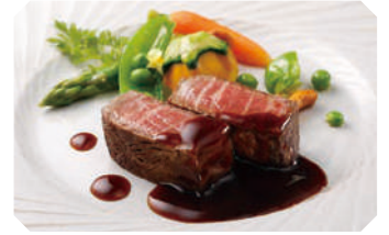
和牛のポワレ 芳醇なマデラワインのソース

表面を香ばしく焼き上げた和牛とマデラワインのソースにより、芳醇な風味が際立つ一品です。