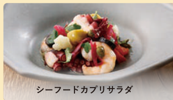
シーフードカプリサラダ