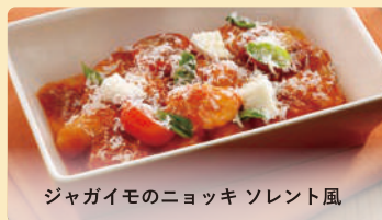
ジャガイモのニョッキ ソレント風