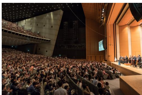
ホールA 0歳からのコンサート