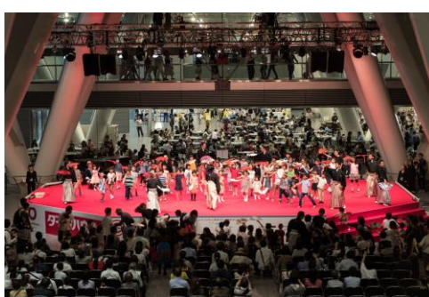
子どもたちの音楽アトリエ(ワークショップ)