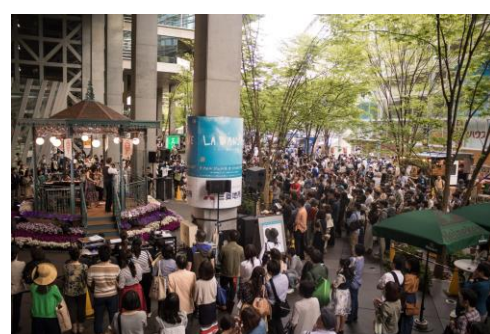
地上広場 キオスク(無料公演)ステージ